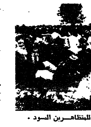
قوات جنوب أفريقيا تتصدى للمظاهرات السود

وقد يبدو هذا كله مبررا من وجهة نظر العدالة ، الا ان في الواقع كل دولة تصرف وفقا لصلحتها الخاصة فقط . ولقد كان هذا شأن العالم دائما ، وسيظل